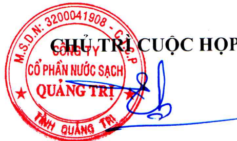
Đào Bá Hiếu